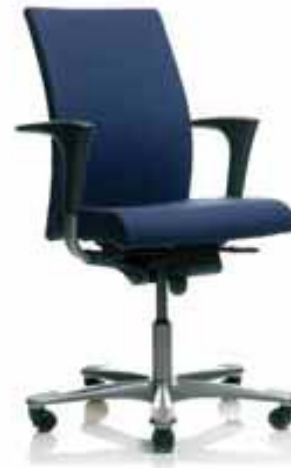
HÅG H04 4650 Version plus large

Sièges habillés en tissu Boss (BOS 4602)