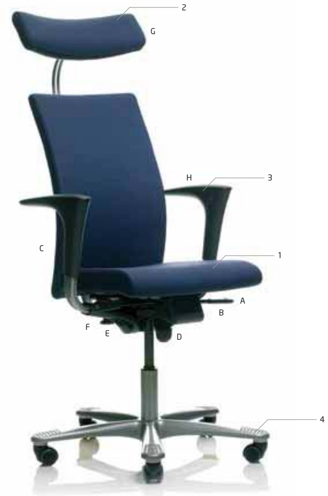
HÅG H04 4600*