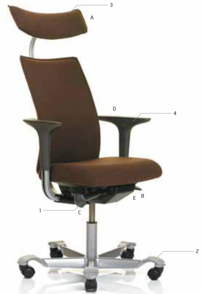
HÅG H05 5600

1. RÉGLAGE 4-EN-1 À L'AIDE D'UNE MOLETTE Profondeur d'assise, hauteur de dossier et la tension de basculement en avant et en arrière.