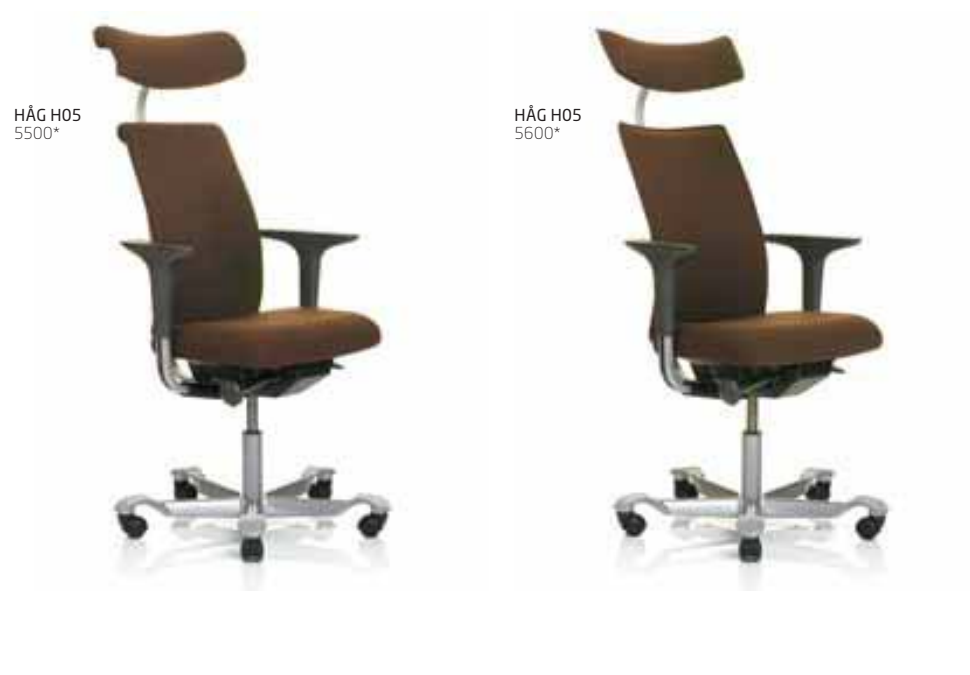
* Appui-tête en option pour tous les modèles. Sièges habillés en tissu FAME (FM 61025).