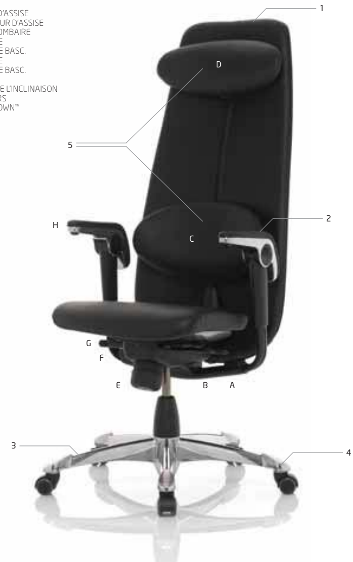
HÅG H09 CLASSIC 9130*