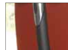
LA COLONNE DU DOSSIER