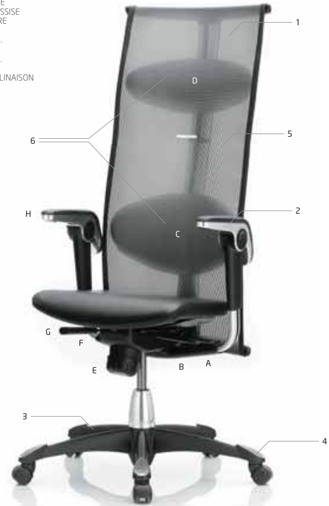
HÅG H09 INSPIRATION 9230