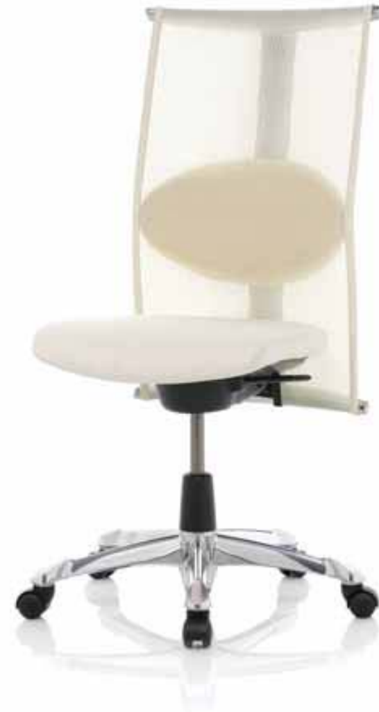
HÅG H09 MEETING 9272*

* Le piètement en aluminium poli est en option au prix supplémentaire. Tissu: Lumina shimmer (SHI 001) sur l'assise.