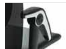
ACCOUDOIRS HÅG TILTDOWN™

Elmosoft: Cuir semi-aniline souple et doux avec une très haute qualité de friction et de respiration.