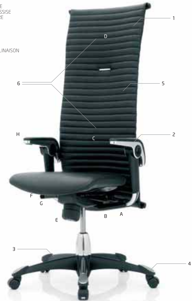
HÅG H09 EXCELLENCE 9330