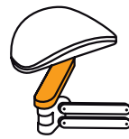
Longueur segment sous support